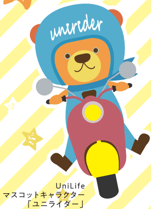
UniLife マスコットキャラクター 「ユニライダー」